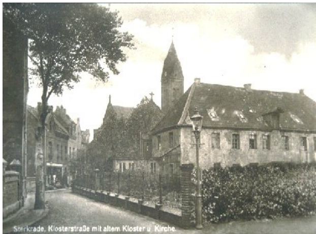
Kloster im Jahre 1872